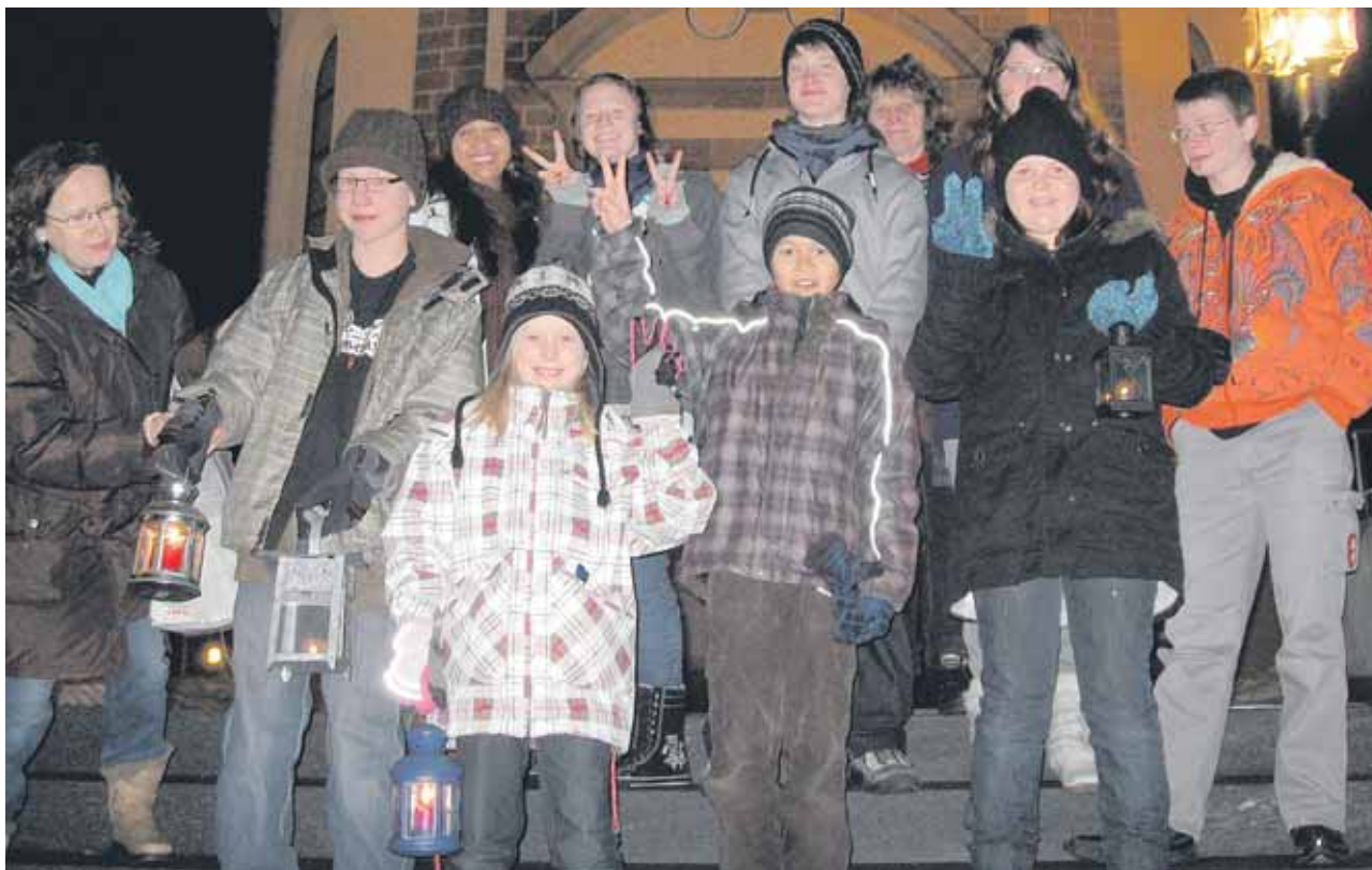
Eine Gruppe von Friedenslichtträgern holte am vergangenen Dienstag das Friedenslicht in Schindellegi ab und brachte es nach Wollerau.

«Wie war der erste Schultag?», fragt Papa seinen Sohn. Der beschwert sich sofort: «Papa. An der Tür stand «Erste Klasse» und als ich drinnen war, gab es dort nur Holzbänke!»