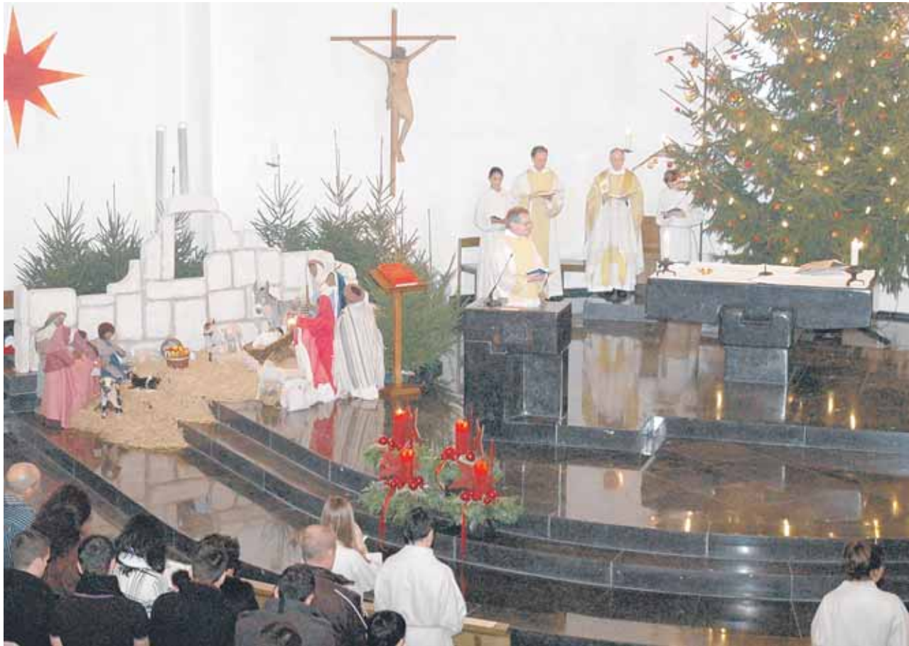
Die Kirche erstrahlte festlich im Glanz der vielen Lichter, umrahmt von Christbaum und Krippe.